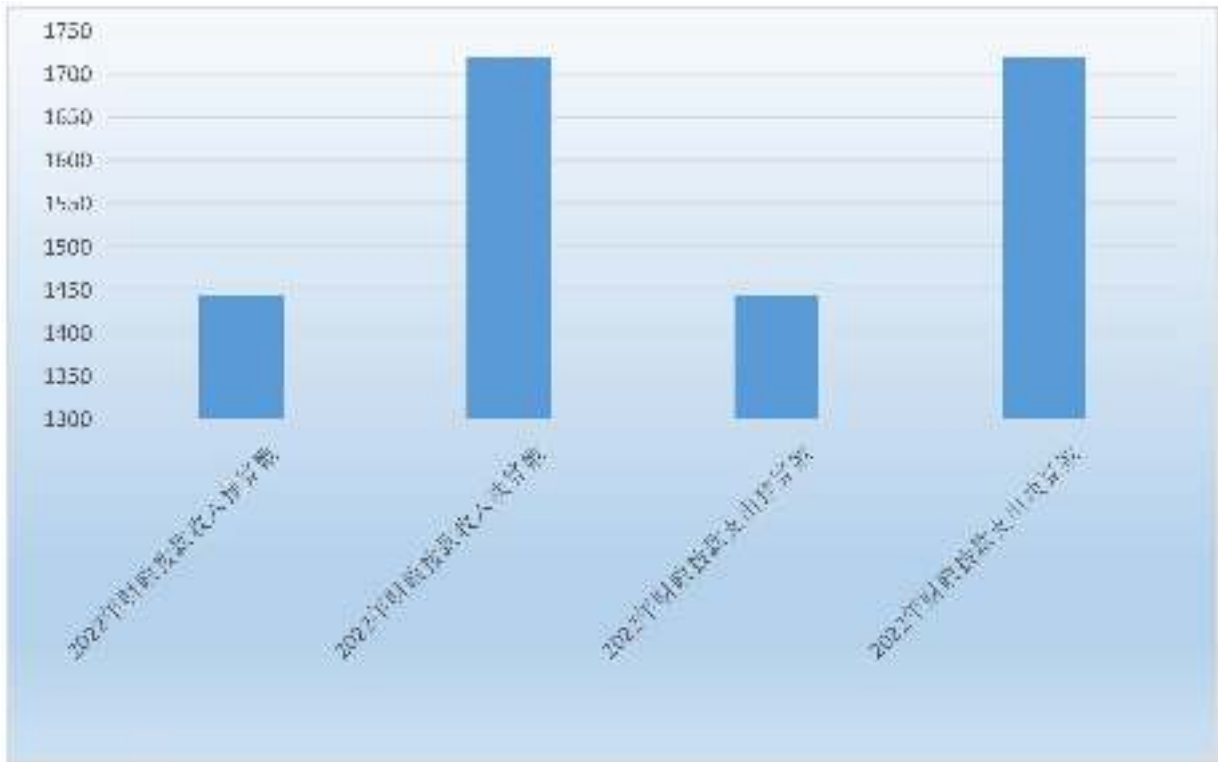
图 4: 财政拨款收支预决算对比情况 (单位: 万元)