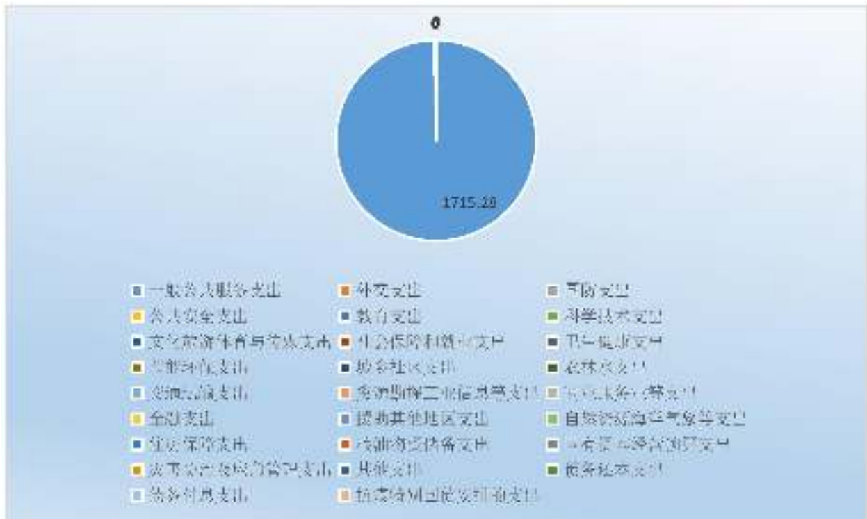
图 5：财政拨款支出决算结构（按功能分类/金额、单位：元）