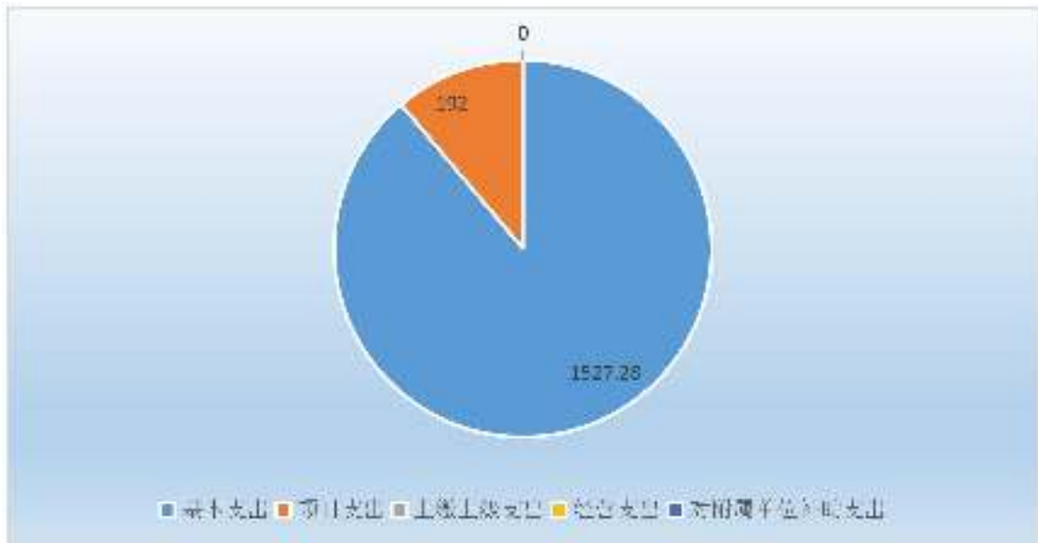
图 2：支出决算构成情况（按支出性质/金额、单位：万元）

元，占 0.00%；对附属单位补助支出 0.00 万元，占 0.00%。如图所示：