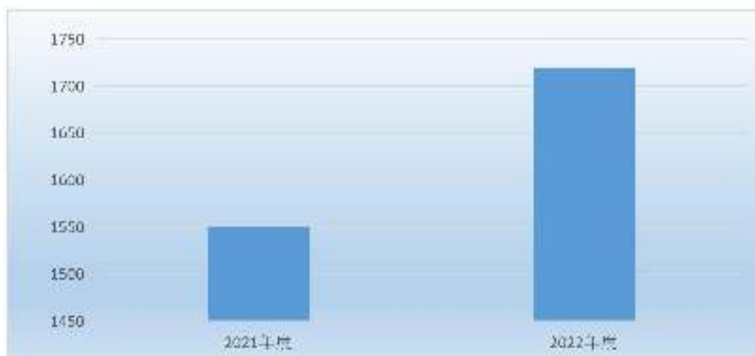
图 1：2021-2022 年收支总计对比情况（单位：万元）

本单位 2022 年度收、支总计（含结转和结余）1,719.28 万元。与 2021 年度决算相比，收支各增加 169.22 万元，增长 10.92%，主要原因是 2022 年统计执法检查等工作开展，经费相应增加。